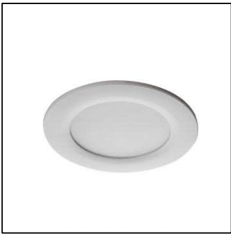
Wzór oprawy podtynkowej